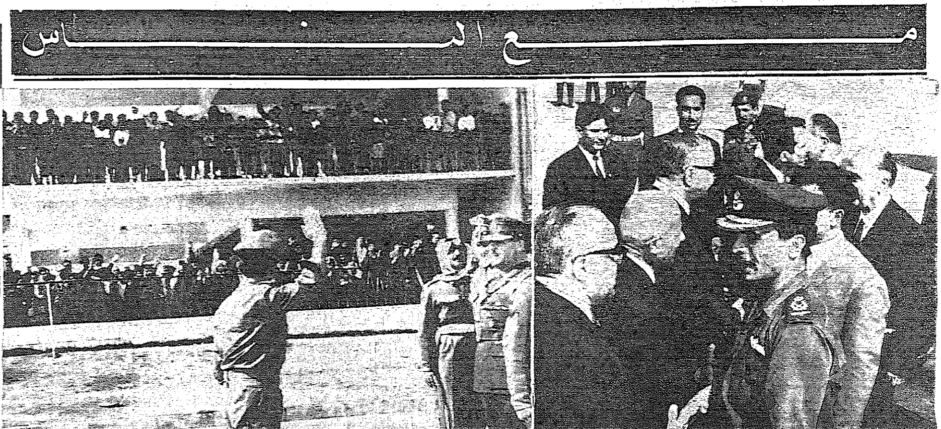
مشهدان من استقبال جلالة الملك الحسين في مطار عمان : الحسين يصافح الوزراء وفي الصورة الثانية جلالته يحيي جموع المواطنين التي احتشدت لاستقباله